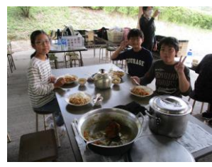
【野外炊さんでの食事】