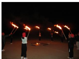
【キャンプファイヤー】