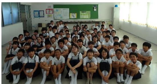
～6年生と北広島市子ども大使の交流～

次に、各学年に分かれて平和学習を行いました。6年生の平和学習には、大曲小学校の子ども大使の方も参加しました。また、平和学習の後には、6年生との交流会も行いました。限られた時間ではありましたが、平和について考えるとともに、北海道北広島市の子ども大使の児童に東広島市や東西条小学校の様子を伝える等して、交流を深めることができました。