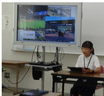
～北広島市子ども大使の発表～

次に、各学年に分かれて平和学習を行いました。6年生の平和学習には、大曲小学校の子ども大使の方も参加しました。また、平和学習の後には、6年生との交流会も行いました。限られた時間ではありましたが、平和について考えるとともに、北海道北広島市の子ども大使の児童に東広島市や東西条小学校の様子を伝える等して、交流を深めることができました。