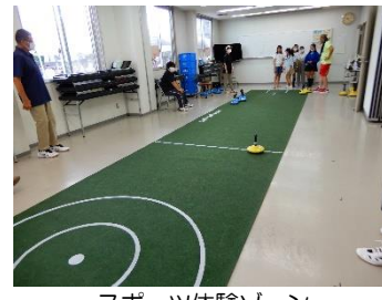
～スポーツ体験ゾーン～