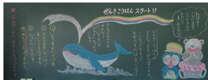
～8月30日の教室の黒板より～

8月30日(火)に前期後半が始まりました。残暑の中、子どもたちは前期のまとめの学習を毎日頑張っています。今年の夏は、例年以上に厳しい暑さが続きましたが、暑さ対策を行いながら、家庭や地域などで充実した夏を過ごしたと思います。夏休み中、これまでコロナ禍で中止となっていた星空まつりや開放プール、北海道北広島市との交流など、4年ぶりに開催された行事も多く見られました。