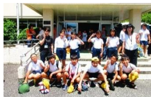
～10名の選手が出場しました！～