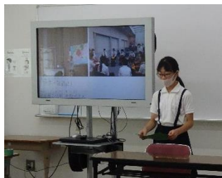
～平和学習バス参加報告～

8月4日、東広島市の姉妹都市である北海道北広島市の大曲小学校から子ども大使を迎え、平和学習や交流会を行いました。リモートによる全校集会で行いました。大曲小学校の子ども大使の児童から、北広島市や大曲小学校の様子等、話をいただきました。全校児童がスキー学習に取り組んでいる等、北国ならではの学校生活に驚きの声が上がっていました。また、平和学習バスの参加報告も行いました。