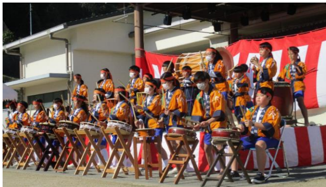
第二十二代 篁太鼓