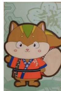
入野小学校ゆるキャラ「どんすけ」