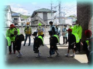
1年生 地域の方に協力いただき下校練習をしました。