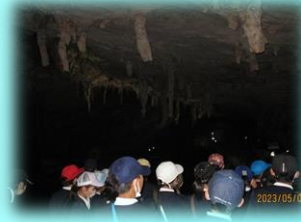
6年生 山口方面へ1泊2日で修学旅行をしました。