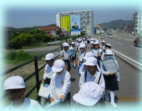
3年生 校区の様子を知るために町探検をしました。