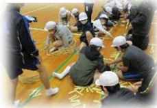
カプラ：班毎に協力して