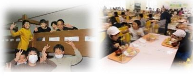
部屋や食堂での楽しい時間