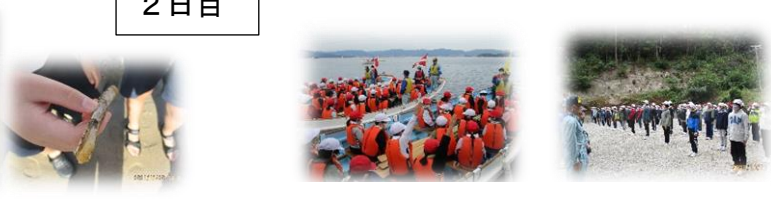
カッター訓練：集団行動の大切さを学びました