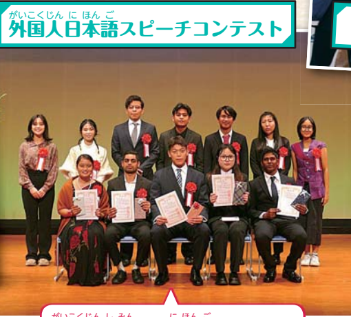
がいこくじん に ほんご 外国人日本語スピーチコンテスト