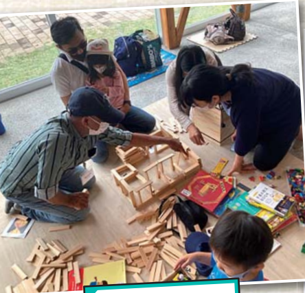
ぼうさい 防災フェスタ