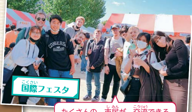
こくさい 国際フェスタ