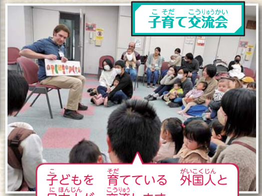
こそだ こうりゆうかい 子育て交流会