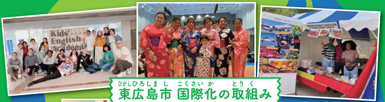
東広島市国際化の取組み

東広島には100以上の国や地域からの 外国人市民 約9000人が共に暮らしています (2024年4月現在)