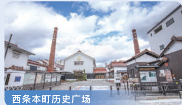
西条本町历史广场

在西条酒藏通上，历史悠久的酿酒厂鳞次栉比。您不想来探访一下这座留存有传统酿酒厂的街道吗？