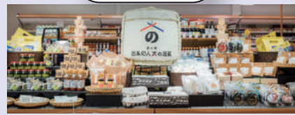
中國、四國地區最大規模的道之驛