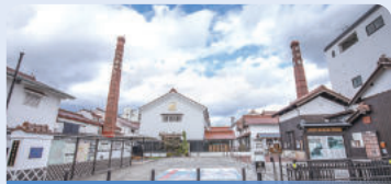
西條本町歷史廣場

西條酒藏通到處林立著歷史悠久的釀酒廠。要不要來場漫遊之旅，體驗傳統的釀酒廠為現代都市渲染出的古香氛圍呢？