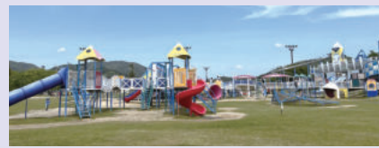
能整日遊玩的大型遊樂器材與露營地

地址 東廣島市西條町寺家10020-43 電話 082-493-8131 公休 無 URL https://www.nonta-sakagura.com/