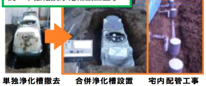
単独浄化槽撤去 合併浄化槽設置 宅内配管工事