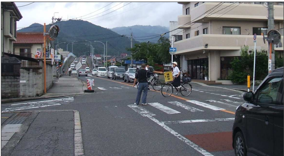
通学路の見守り活動

学校関係者への周知や情報共有を目的として、「通学路安全対策要望件数一覧」、「通学路安全対策一覧表」及び「通学路合同点検実施一覧・箇所図・対策写真」を作成し、東広島市ホームページで公表します。