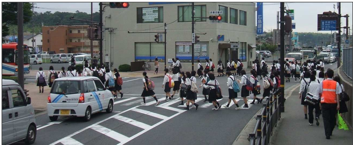
歩車分離式信号の設置