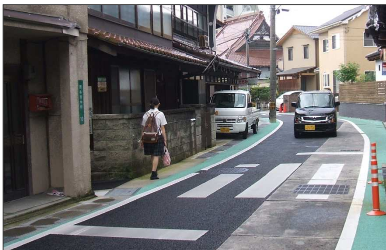
ラバーポールの設置と 路側帯のカラー舗装化