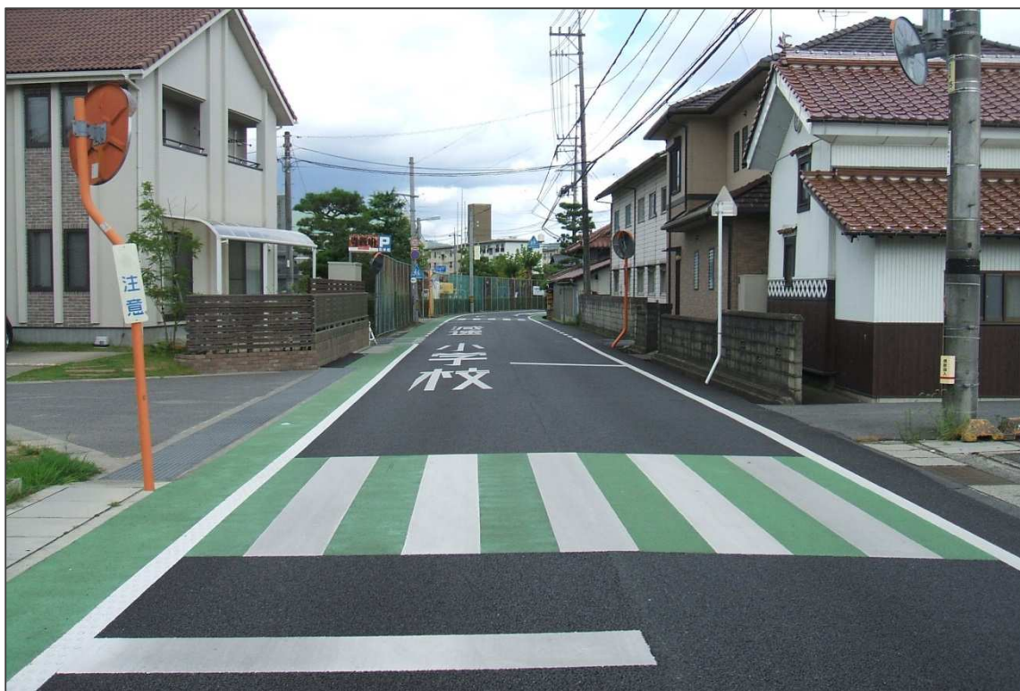
「減速 小学校」の道路標示と、路側帯や横断歩道のカラー舗装化