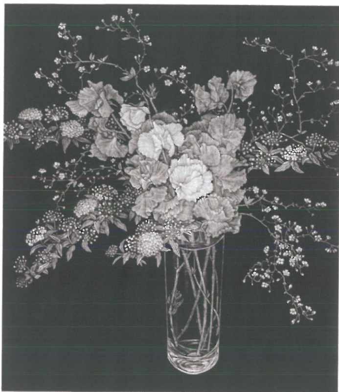
丹阿弥 丹波子 「春の花'96」 1996年