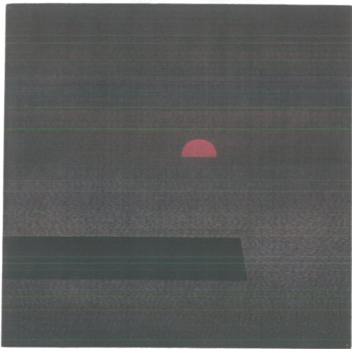
浜口 陽三 「突堤」 1965年 協力：ミューゼ浜口陽三・ヤマサコレクション