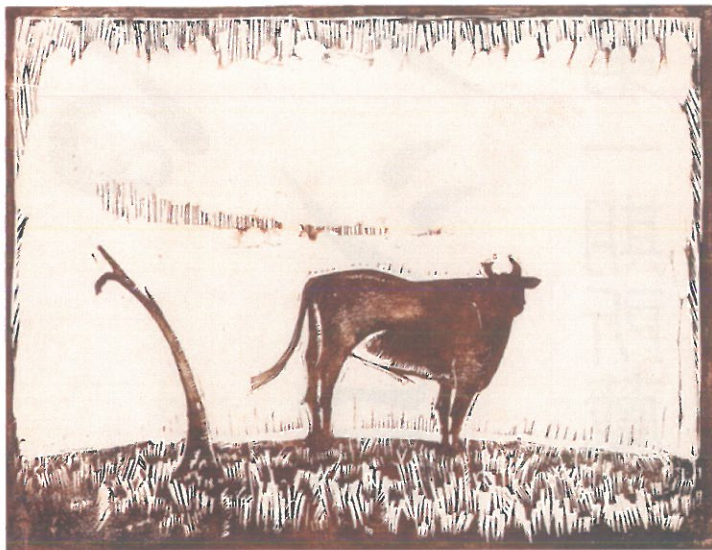
藤森 静雄 「丘」 1925年