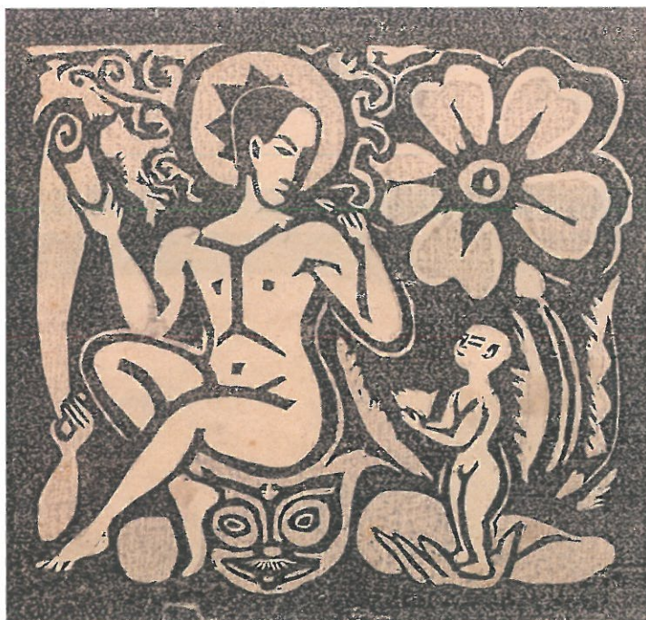
谷中 安規 「花鳥」 1933年