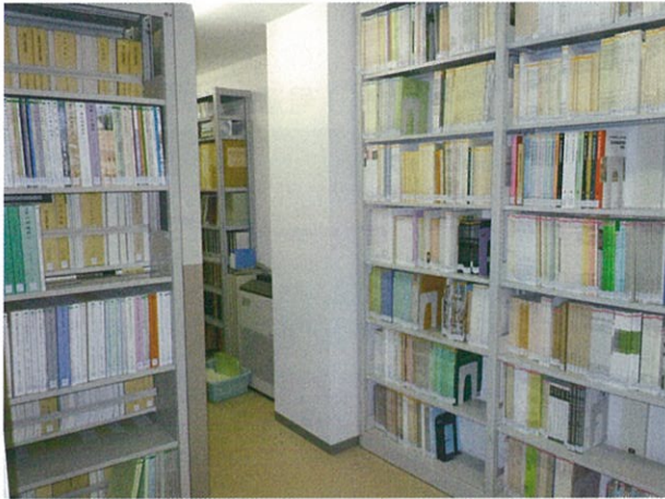
図書収蔵庫：全国の報告書を収蔵しています