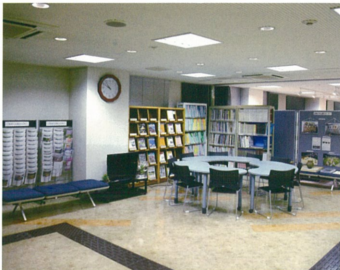
ホール：発掘調査報告書などをみることができます