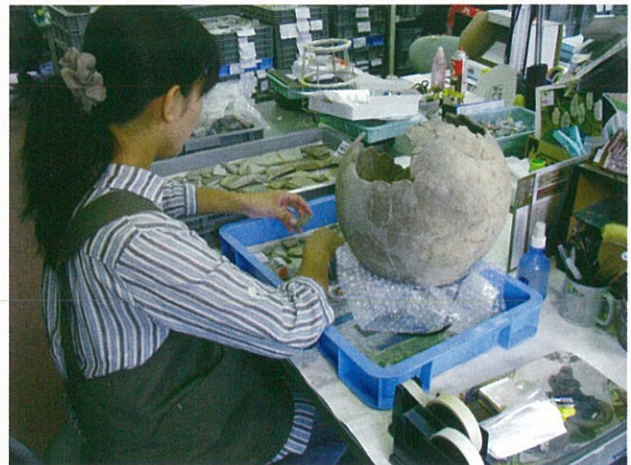
遺物整理室での土器の復元作業のようす

東広島市の歴史の一端をかいま見ることが出来る施設を目指していきますので、お気軽にお立ち寄りください。