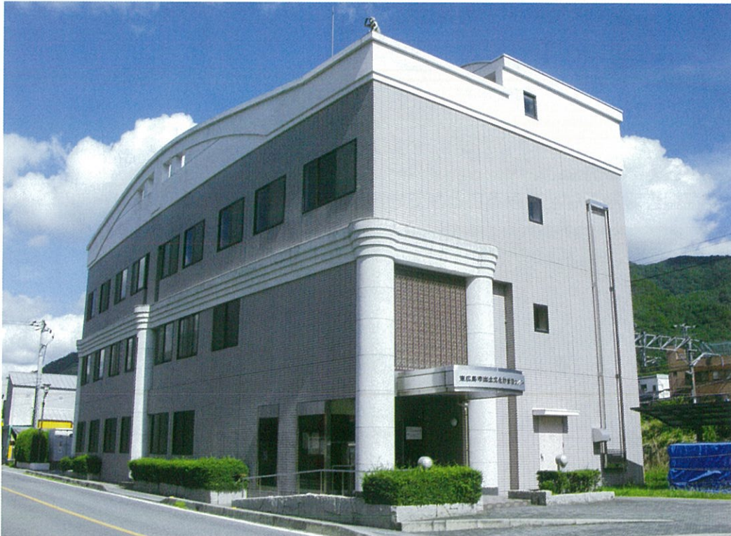
東広島市出土文化財管理センター外観