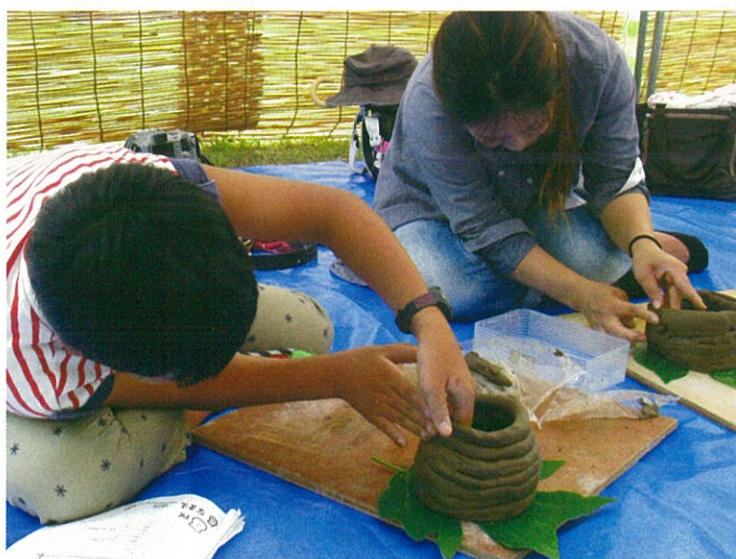
歴史体験イベント：親と子の体験歴史村の一コマ