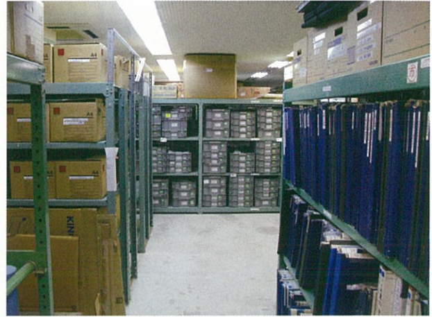
遺物・図面収蔵庫：報告後の資料を保管します

発掘調査で得られた遺物は、直ちに「洗浄」され、出土場所などのデータを遺物に書き込む「注記」作業が行われます。そして壊れているものが大半なため「接合」して、欠けている部分を「復元」する作業を経て、調査員によって「図化」されます。合わせて「写真撮影」や「文章」作成、図面の「浄書」も行われて報告書の原稿となります。これらのプロセスを経て刊行された発掘調査報告書は、壊されてしまう遺跡を「記録保存」する資料の一部として公開・活用されます。