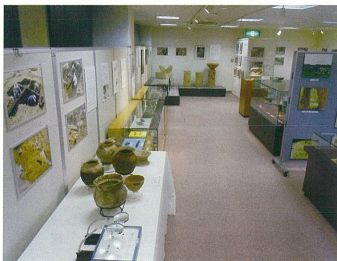
展示室：発掘調査の出土品を展示しています

して、市内学校を対象にした歴史体験イベントや出土品に触れてもらいながら歴史を学習できる催しも各種開催しています。