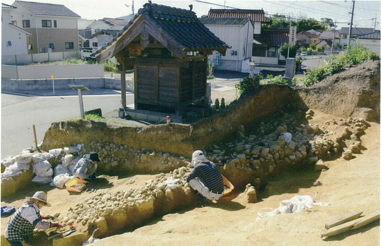
写真1 才免遺跡（積石塚）の発掘調査の様子

才免遺跡は、平成27年9月～12月まで住宅団地造成事業に伴い発掘調査を実施しました。造成計画地のうち、宅地になる部分は盛土をして遺跡をそのまま保存することになりましたが、切土や道路などの工事で遺跡が壊れてしまう部分について、発掘調査を行いました。