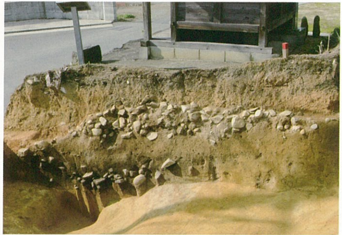
写真2 積石塚の断面