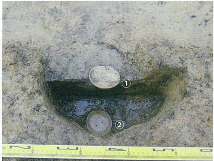
写真5 柱穴から“かわらけ”が出土した様子

“かわらけ”の出土状況や土層断面を観察したところ、このピットは掘立柱建物の柱を立てた穴の一つと考えられ、柱を抜き取った後、その中に丁寧に置いた可能性が出てきました。解体されて役割を終えた建物への感謝と、次の建物などに転用される部材への安全を祈願した痕跡とは考えられないでしょうか？ しかし、残念ながら、限られた調査範囲であったため、このピットがどのような建物であったかは分かりませんでした。