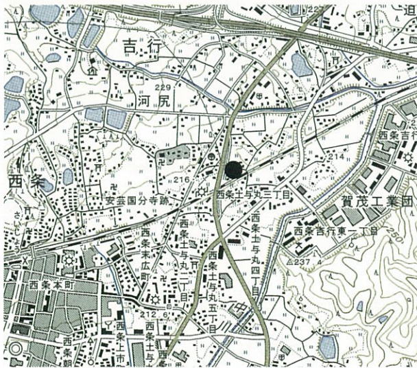
図3 鷺田遺跡位置図（1：25,000）