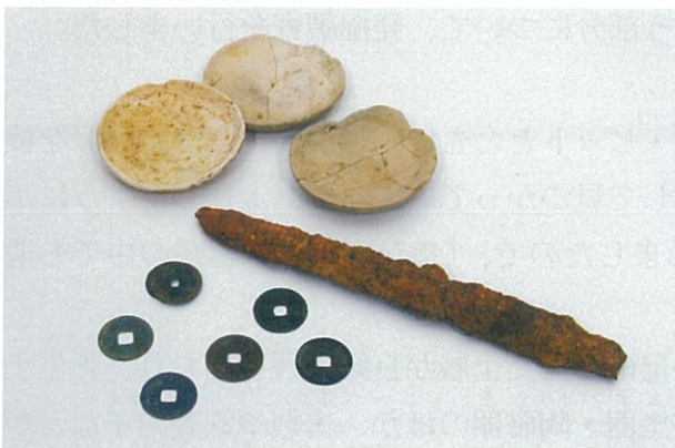
写真3 積石塚から出土した遺物（一部）