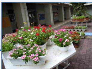
中庭のプランターの花