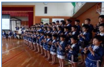
本番へ向けて練習