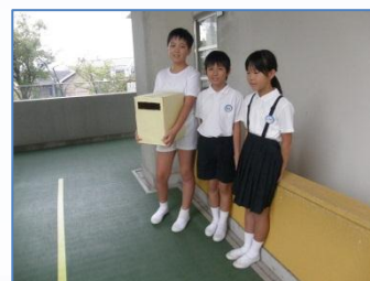
義援金を呼びかける児童会計画委員会

また、PTAでも9月27日の土曜参観日に、義援金の取り組みを行う予定です。ご協力をお願いいたします。