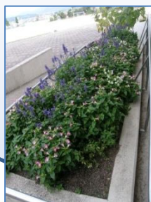
体育館横ブルーサルビアが満開