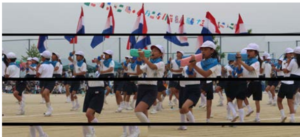
【息の合った演奏と動きに大感動 鼓笛5年生】