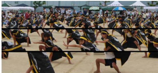
【力強さと気合いのこもった高台ソーラン 4年生】