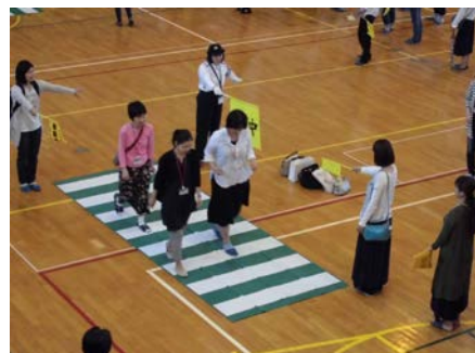
<交通指導教室の様子>

学校でも、登校班の班長指導や一斉下校時の交通安全指導を行っておりますが、旗当番の際に危険な行為等ありましたら、その場でご指導いただくとともに、学校へもご一報いただくとありがたいです。どうぞよろしくお願いいたします。