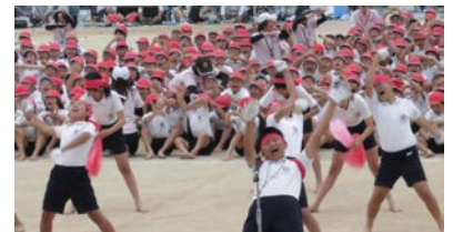
【勝利に向かって 応援合戦】