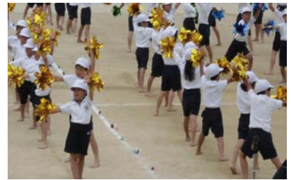
【踊りも表情もキラキラダンス 2年生】