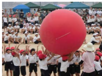
【白熱した 全校競技】