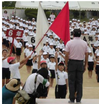
【校長先生の前で力強く 選手宣誓】