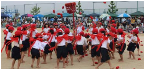
【踊りも玉入れも元気いっぱい 1年生】

さて、5月28日（土）に開催いたしました第57回春季大運動会には、多くのご来賓の皆様、保護者・地域の皆様にご参加いただきました。運動会のテーマ「走り抜け！自分の心に火をつける」のもと、力を出し切る子どもたちの演技に、皆様から大きな歓声や声援・拍手をいただきました。誠にありがとうございました。