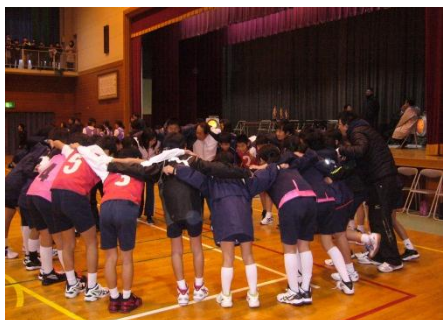
円陣を組んで気持ちを一つに

1月16日に、本校を会場とし、東広島市小学球技交流会が行われました。本校はAブロックで、本校以外の大規模校3校(寺西小、川上小、八本松小)と対戦しました。当日は、5・6年生の児童20人がチームワークよく一生懸命プレーをし、チームワーク賞を受賞しました。精一杯最後までプレーした児童は、プレーはもちろん、校外での立ち居振る舞い(挨拶や礼等)も大変立派でした。練習中や当日の児童の送迎、応援等、保護者の方にご協力をいただき、誠にありがとうございました。