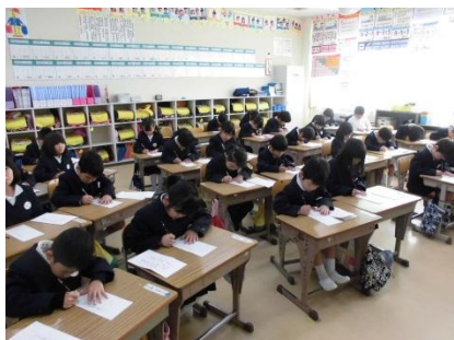
1年生「小学生になってはじめてのお正月です」(硬筆)

後期後半が始まった1月7日、全校一斉に校内書き初め競書会を行いました。姿勢を正し、中心に気を付けながら一文字一文字気持ちを込めていねいに書き上げました。心新たに学習に取り組もうとする気持ちが、一人一人の真剣な表情から伝わってきました。