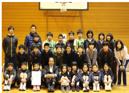
みんなでやり切った満足な顔