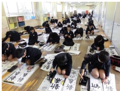
6年生「伝統を守る」(毛筆)