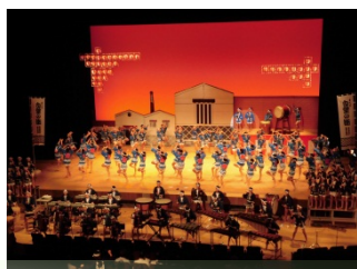
【感動のクライマックス】

7月20日（木）開催の「中国地区市町村教育委員会連合会研修大会」のオープニングセレモニーにおいて、東広島芸術文化ホールくらら大ホールで、ついに第37代オペラ「白壁の街」を上演しました。短期間の練習とは思えない表現力で、観客の方々に大きな感動を与える素晴らしい演技でした。6年生は、授業時