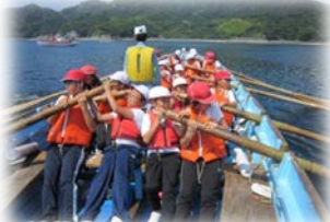
【全力 カッター訓練】