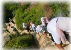
【駆け巡るオリエンテーリング】