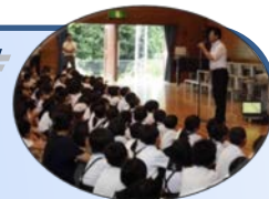
【前期後半始まりの式の様子】

まだまだ強い日差しの中、子ども達が元気に登校してきました。5名の転入生を迎え、全校児童1091名で前期後半始まりの式を行いました。学校長から、前期後半も「自分から進んで行動しよう」という話があり、次に生徒指導の担当から「ぴかぴか」で「ありがとう」がいっぱいの学校にしようという話がありました。その後、各学級で担任から、「これからの学習と生活でこんな力を身に付けていこう」という話をしました。子どもたちは、姿勢よく話を聞き、やる気を感じられる前期後半のスタートとなりました。