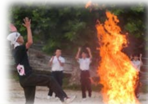
【燃えろ キャンプファイヤー】