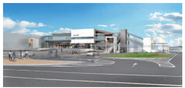
【整備イメージ】 北口広場からJR西高屋駅を望む