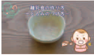
意外と簡単なとろみのつけ方