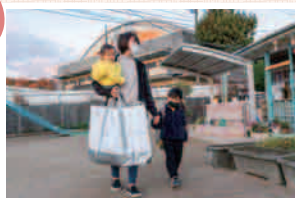
朝7時。家へ迎えに行き、保育所へ送り届けます