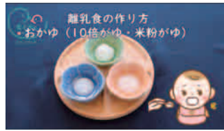
動画で分かりやすく紹介