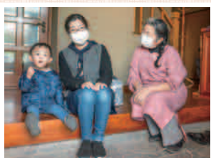
「安心して預けられます」