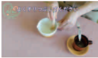
10倍がゆの作り方も紹介