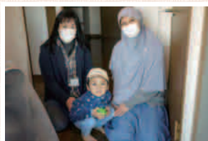
ママが仕事で手を離せないときの預かりもOK