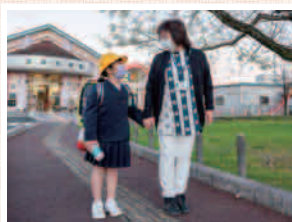
お迎えの依頼も多いです