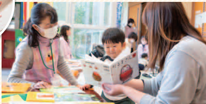
11月24日に「すくすくサポート福富」で開催された「ブックデビュー」の様子

乗り物の絵本やしかけ絵本が 好きみたい。寝る前の絵本タ イムを無理なく続けたいです。