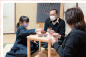
「孫と遊んでいるような感覚です」