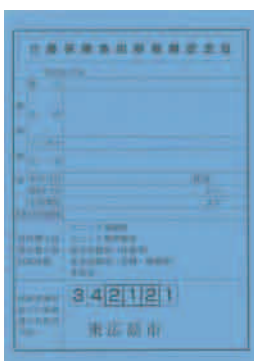
介護保険負担限度額認定証