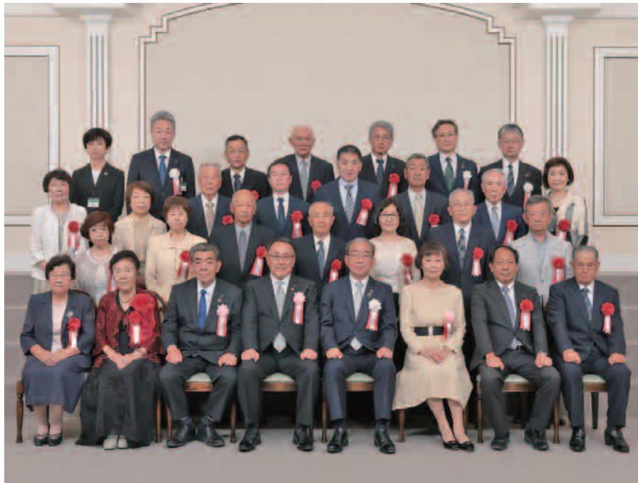
※写真撮影時のみマスクを外しました