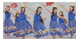
わくわくステージ