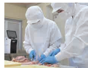
豊栄町の食肉処理場で、東広島こい地鶏の加工を行う様子

消費者に届くまでに欠かせない、食肉加工・卸も東広島の企業が行います。豊栄町を拠点に、地域課題解決に取り組む合同会社CONTACTが手を挙げ、令和6年6月から、新規事業として鶏の食肉処理や加工商品の開発、料理店などへの卸業務を行っています。