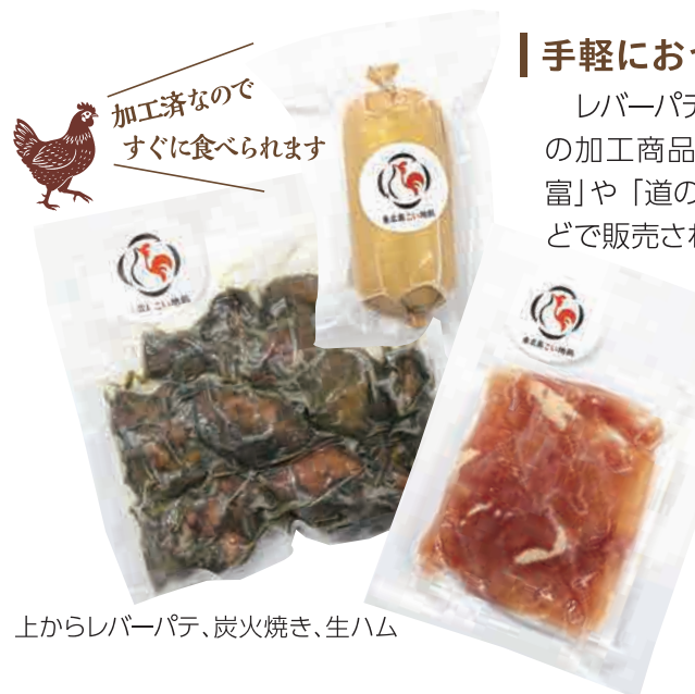
上からレバーパテ、炭火焼き、生ハム

レバーパテや炭火焼き、生ハムなどの加工商品が、「道の駅湖畔の里福富」や「道の駅西条のん太の酒蔵」などで販売されています。