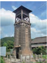
時報塔(志和町志和堀3324-7)