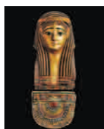
ミイラマスク/ブレスレット オス朝時代 古代エジプト美術館 渋谷蔵

「古代エジプト美術館 渋谷」の国内第一級の内容を誇るコレクションから、世界的に貴重なミイラやミイラマスク、木棺、当時の生活様式が分かる容器やアクセサリーなど約200点を展示 日時 10月10日(火)～11月26日(日) 前売券・当日券販売場所／市立美術館、セブン-イレブン(セブンコード：102-269) 料金 一般1,300円(1,040円)、大学生900円(720円)、高校生以下無料 ※( )内は前売または20人以上の団体当日料金 ※前売券販売期間／10月9日(月・祝)まで ※その他の割引は「特別展で利用できる割引」をご覧ください。