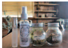
※写真はイメージです。実際と異なる場合があります。

「神の香り」と呼ばれる「sTin Tr」と死者にささげられた「anx」の香りづくりを体験!