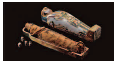
ホルスの4人の息子たちの護符とプタハ・ソカル・オシリス神のミイラ/末期王朝~プトレマイオス朝時代 古代エジプト美術館 渋谷蔵

「古代エジプト美術館 渋谷」が所蔵する日本最大級の質と量を誇る古代エジプト王朝美術のコレクションからミイラやミイラマスク、アクセサリーなど約200点を展示