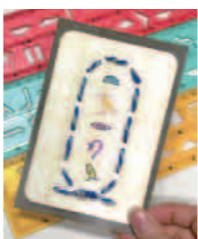
※写真はイメージです。実際と異なる場合があります。

古代エジプトで発明された象形文字「ヒエログリフ」。色鉛筆などでカラフルに、ヒエログリフをかいてみましょう。