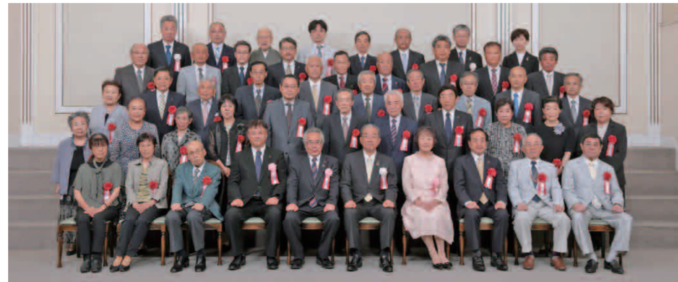
令和5年度 東広島市表彰 表彰式