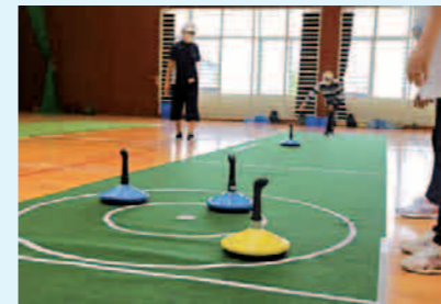
▲ユニカール (室内で気軽にできるカーリング)

★ユニカールとは 2チームのプレイヤー (各3人) が交互にストーンを投げ、味方のストーンを相手チームのストーンよりもセンターサークルに近づけることを競うゲーム。