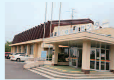
▲黒瀬B & G海洋センター