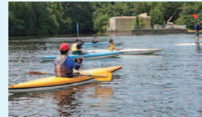
▲亀ヶ首池でのカヌー体験