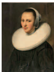
レンブラント・ファン・レイン (装束を着けた女性の肖像) 1644年

ポーランドのヨハネ・パウロ2世美術館のポルチェンスキ・コレクションから、レンブラントやゴヤなどルネサンス以降400年にわたる西洋絵画を紹介。