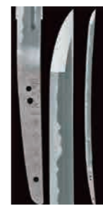
【広島県重要文化財】(刀)銘藤州大山住宗重作 室町時代末期 個人蔵

日時 10月15日(火)~12月1日(日) 料金 一般1,000円(800円)、大学生700円(560円) ※( )内は前売または20人以上の団体料金 前売券・当日券販売場所/市立美術館、セブン-イレブン (セブンコード:107-020) 前売券販売期間/8月9日(金)から