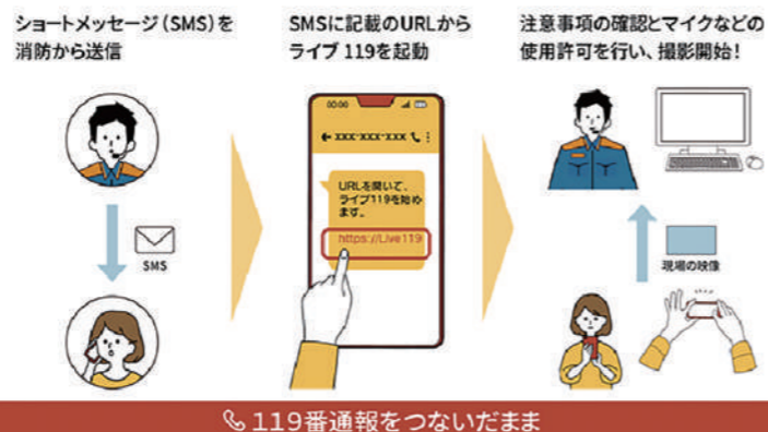
☎119番通報をつないだまま