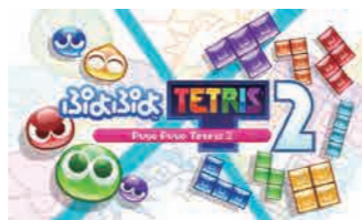
©SEGA Tetris® & © 1985-2024 Tetris Holding.