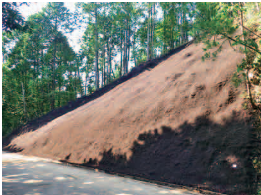
豊栄町 林道天神線（工事完了）