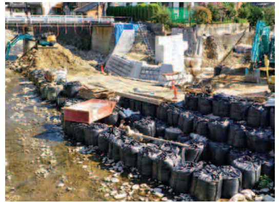
安芸津町 横川橋（工事中）