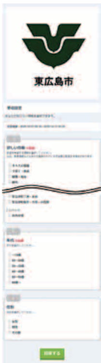
受信設定画面（イメージ）

※受信設定が実際のメッセージ配信に反映されるまで数日かかる場合があります。 ※緊急情報など重要な情報は、受信設定に関わらず全員に配信します。