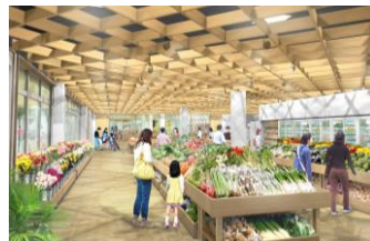
直売所のイメージ

加工室3室（販売ブース有）、シャワー施設、多目的展示室、屋根付き広場、授乳室、防災倉庫、緑地（ドッグランを含む）、情報発信施設、トイレ棟 ※年中無休