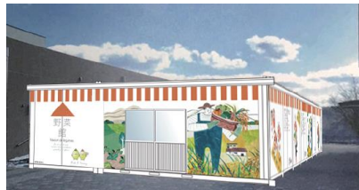
新設増床する直売所のイメージ