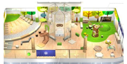
屋内遊戯場のイメージ