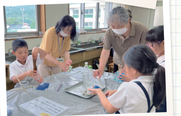
地域住民に教わりながらスライム作り