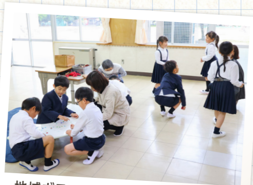
地域ボランティアが見守り中、昔遊びの玩具や絵本がある部屋で思い思いに過ごす児童