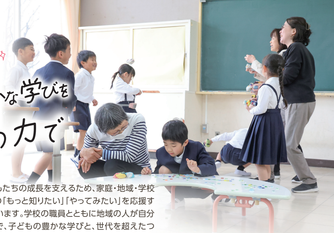
昔遊びの玩具で一緒に遊ぶ風早小学校の児童と地域ボランティア

☎ 指導課 ☎ (082) 420-0976 青少年育成課 ☎ (082) 420-0929