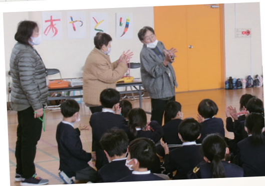
昔遊びを教える授業。あやとりやけん玉、お手玉などが得意な地域住民が講師を担当

令和7年度は、地域住民約20人がボランティアとして登録し、年間延べ230人が活動しました。登下校の交通指導や学校行事・授業のサポート、ときには講師となって子どもの学びや育ちを支えました。