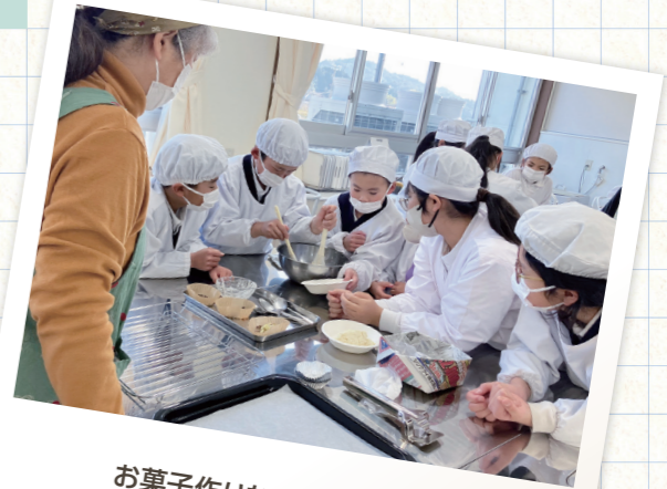
お菓子作りなどの調理実習