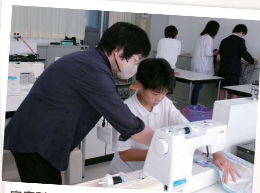
家庭科の授業で地域住民がミシンの操作をサポート。一人一人のペースに合わせて指導