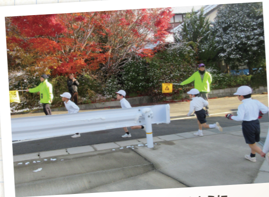
持久走大会を安全に行えるように地域住民が見守りスタッフとして参加