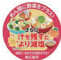
このポップが目印！