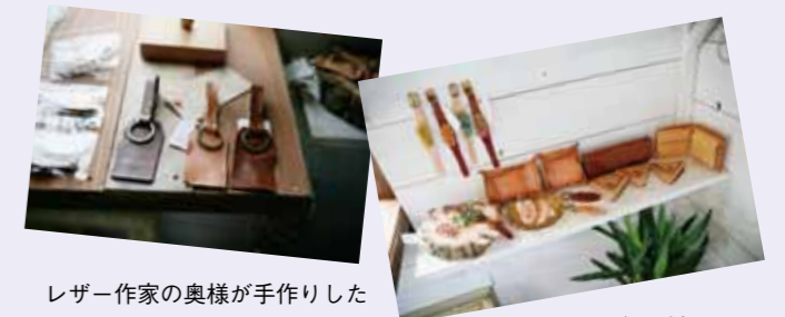
レザー作家の奥様が手作りしたかわいい革製品がたくさん！

人との出会い、付き合いがあって、色々な交流が生まれて膨らんでいき、人生が豊かになるんだと思います。ぜひ一度、福富へ来てみてください。素敵な人、素敵なお店がいっぱいです！