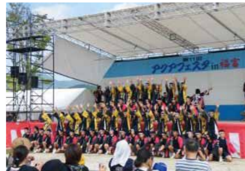
アクアフェスタin福富