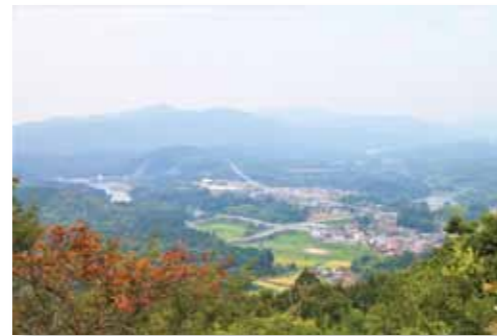
虚空蔵山から道の駅「湖畔の里 福富」を望む

新たな取り組みとして、古民家改修プロジェクトも行われており、改修後は地域活性化の拠点として活用を予定されています。