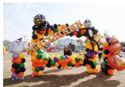
2016年に初開催された「ハッピー・ハロウィンラン」