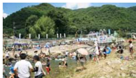
夏の一大イベント「リバーサイドフェスティバル」

その他にも、竹林寺はなまつり、篁ふれあい祭り、ふれあいマラソン大会、そば処さわやか茶屋まつりや各地域の夏祭りなど、地域のイベントも豊富に開催されています！