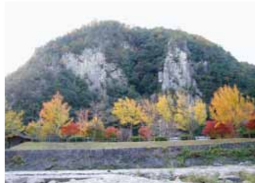
雄大な渓谷美を誇る深山峡

河内町は、東広島市東部に位置する標高60m～600mを有する地域で、山あいを流れる川と山に囲まれた地形は、壮麗な自然を体感できる地域です。この河内地域には、JR山陽線の「河内」、「入野」の2駅、山陽自動車道「河内」ICのほか、広島の空の玄関「広島空港」にも近く、都市へのアクセスも抜群です。住宅団地や流通団地もありながら、河内中心部は、大正から昭和にかけての街並みが残る「レトロ感漂う」地域なんです。