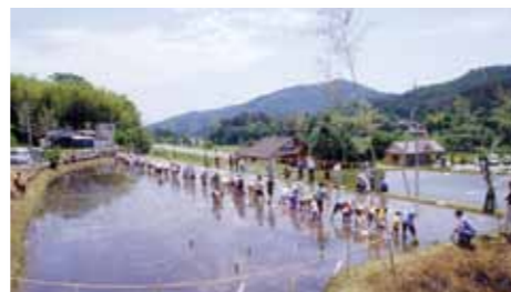
様々な催しが行われる「小田宮農田植まつり」