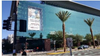
アリゾナ州立大学本部