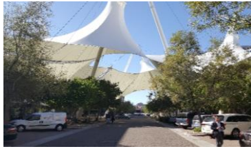
スカイソング（研究施設等）