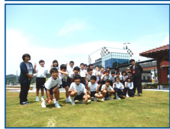
広島中央エコパーク