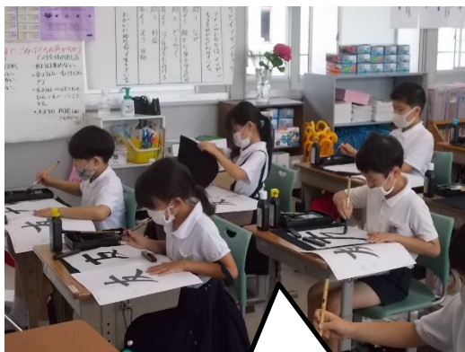
集中して「友」の清書をしました。

雨も多く、蒸し暑い日が続いていますが、図工や書写など毎日の勉強を頑張っています。どんなことがあっても、粘り強く取り組むことができる人が増えてきました。臨時休業中にご家庭でやりきることを経験させていただいたおかげです。ありがとうございます。