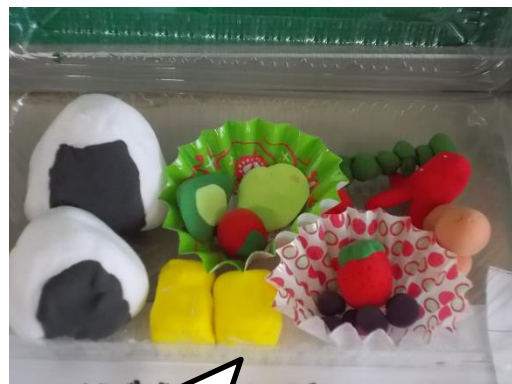
図工で「おべんとう」をつきました。食べたくなるような作品がたくさんできました。