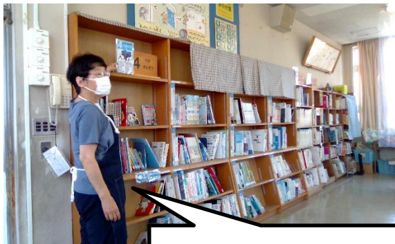
司書の先生に図書室の本について教えてもらいました。