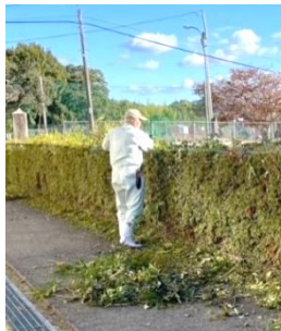
垣根もきれいになりました

初参加や久々に参加された方、お孫さんが原小児童という方など、参加の輪が広がっています。