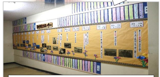
職員室横の掲示版「原小 150 年のあゆみ」