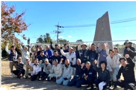
参加者で記念撮影 お疲れさまでした！