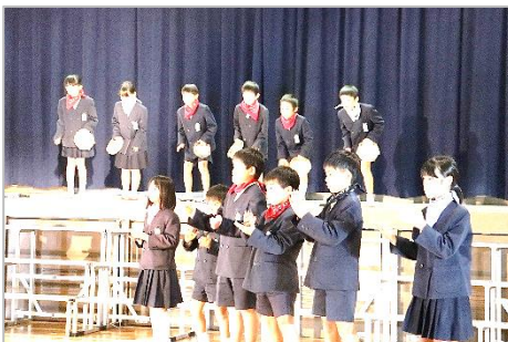
4年 音楽「われら第4音楽隊」