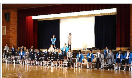
3年 音楽劇「モチモチの木」