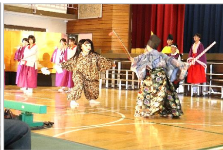
5年 表現「あやめの前伝説」