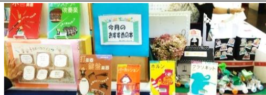
11月テーマ「音楽♪」クイズなど、楽しいコーナーができました