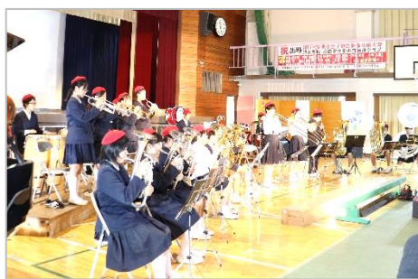
6年 スクールバンド 「奏でる わたしたちの ハーモニー」