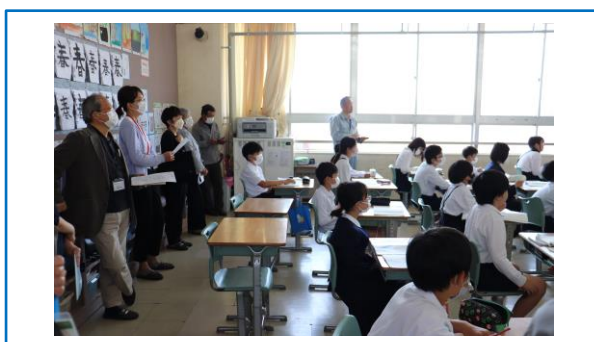
← 第1回学校運営協議会の前に行われた授業参観の様子(5/11)

地域における教育力の低下、家庭の孤立化などの課題や学校を取り巻く問題には、社会総がかりで対応することが求められており、そのためには地域と学校の 組織的・持続的 な取り組みが必要不可欠なため。