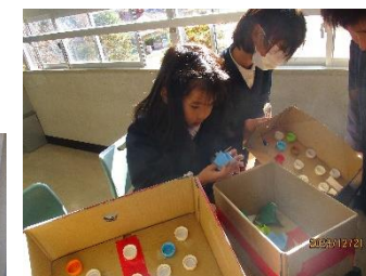
ビー玉ころがしゲーム