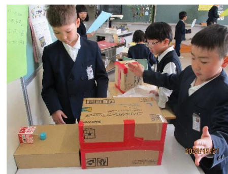
空気砲シュートゲーム