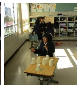
紙コップロケット