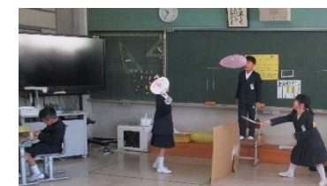
風船バレーボール