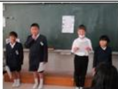
事故から守る仕事チーム