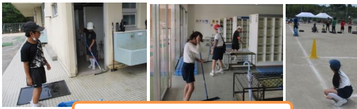
前日準備頑張りました!

今回培った力を生かして, 今度は宿泊学習へ向けて取り組んでいきたいと思います!!