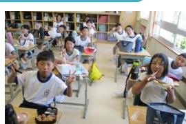
終わってほっと一息 お弁当ありがとう ございました。