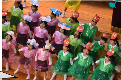
歌も、楽しく元気に歌うことができたよ。