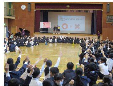
〈1年生を迎える会：貨物列車や学校クイズの様子〉

1年生を迎える会の後は、子どもたちが楽しみにしている遠足に出発です。雨が降ったため、出発時刻や場所を変更しましたが、どの学年もしっかりと歩いて目的地に到着し、友だちとの時間を楽しむことができました。思い出に残る一日となりました。お弁当等、準備物のご協力ありがとうございました。