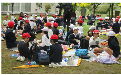
〈2・3・4年生：三永水源池サイエンスパーク〉 3学年でともに活動し一緒においしいお弁当を食べました。