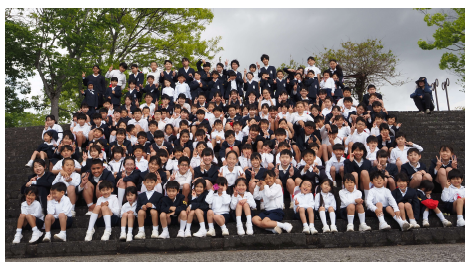
〈1・6年生：サイエンスパーク〉 1年生と6年生の関わり合いが、とてもほほえましかったです。

1年生を迎える会の後は、子どもたちが楽しみにしている遠足に出発です。雨が降ったため、出発時刻や場所を変更しましたが、どの学年もしっかりと歩いて目的地に到着し、友だちとの時間を楽しむことができました。思い出に残る一日となりました。お弁当等、準備物のご協力ありがとうございました。