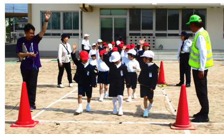
〈渡り方の指導の様子〉

子供たちの通学路は、道路の状況や交通量もさまざまです。毎朝多くの見守り隊の方や保護者の皆様が見守ってくださっていることや、登校班の班長や副班長が班員の安全に気を配ってくれていることで、安全な登下校ができています。ありがとうございます。感謝するとともに、自分の命を守るためには、交通ルールを守ることや自分で安全を確認することが大切です。学校でも日々指導してまいりますので、ご家庭でもよろしく願いいたします。