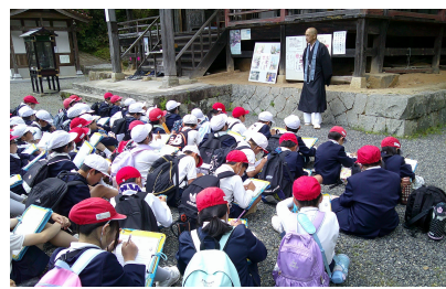
〈5年生：福成寺〉 長い距離を歩き切りました。住職のお話を聞く態度も素晴らしかったです。