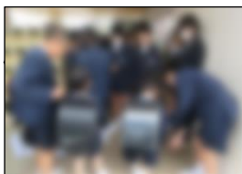
6年生児童による出迎えの様子

令和6年度がスタートしました。お子様のご入学・ご進級おめでとうございます。始業式に臨んだ子供たちの元気な挨拶・返事や話す人の方を向いて聞き入る姿に、私たち教職員も、子供たちと共に頑張る決意をさらに強く持ちました。