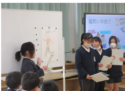
<企画を提案する4年生>