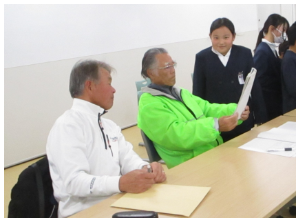
<地域の方からアドバイスをいただく様子>