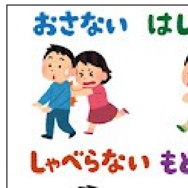
<避難の際の合言葉「おはしも」>

この機会に、ご家庭でも、災害発生時の避難等について、話題にしていただけるとありがたいです。