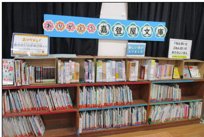
<図書室に配架された嘉登屋文庫>

このようにたくさんの本をいただきましたことに対しまして、公益財団法人嘉登屋記念事業団様に厚くお礼申し上げます。そして、これからも図書を大切にに使わせていただきます。